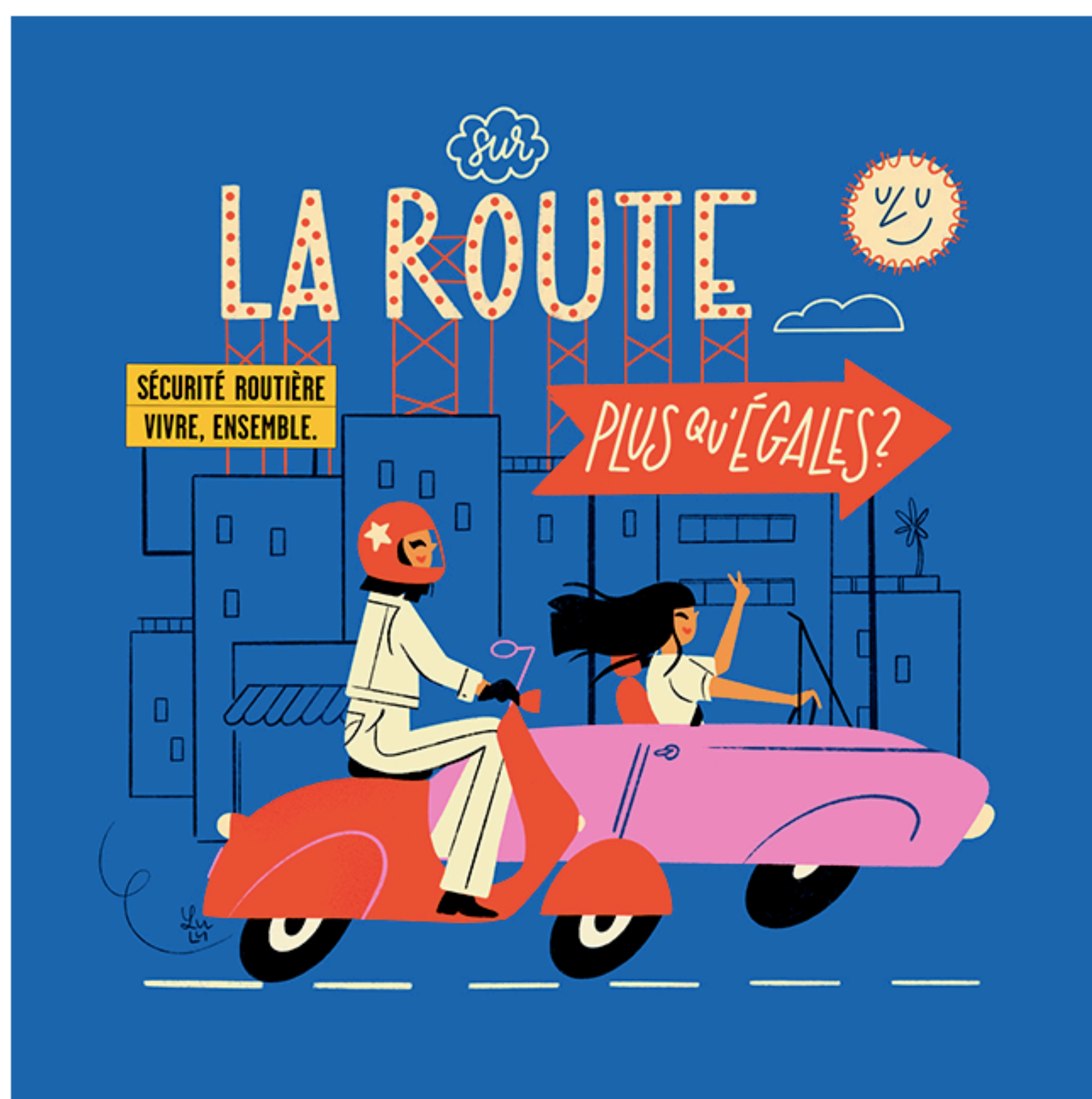
Illustration en pièce-jointe

À l'occasion de la Journée internationale des droits des femmes, la Sécurité routière rappelle que sur la route, les femmes n'égalent pas les hommes, elles sont supérieures ! Loin des célèbres clichés leur attribuant une conduite dangereuse, les chiffres démontrent, en effet, qu'elles causent moins d'accidents, meurent moins sur la route et contribuent ainsi à la rendre plus sûre. Une femme est tuée chaque jour dans un accident de la route dont un homme est responsable. En 2018, elles représentaient moins d'un quart des auteurs présumés d'accidents mortels sur la route, et seulement 17,8% des permis de conduire invalidés. Alors en cette journée qui est la leur, Messieurs, passez le volant !