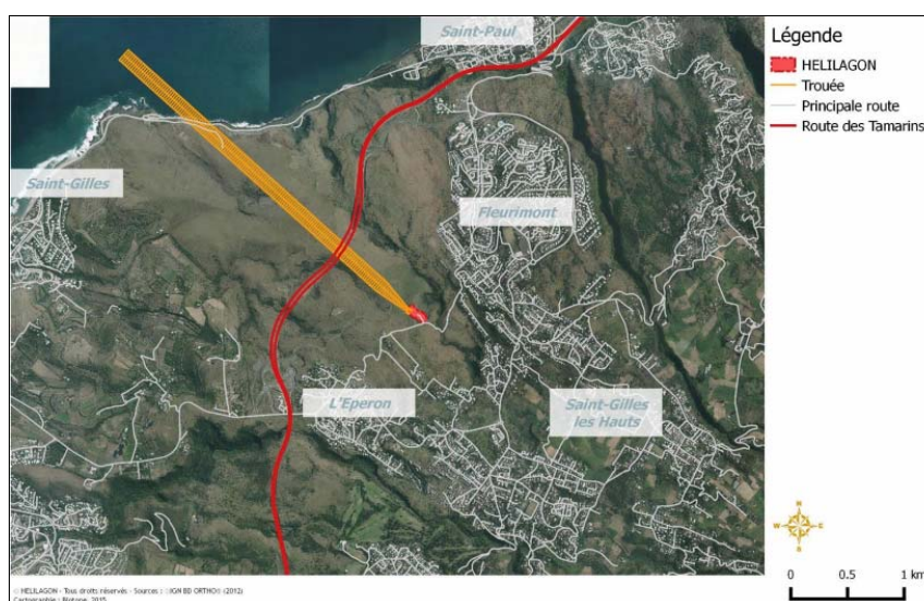
Figure 3 : Illustration de la trouée de décollage et d'atterrissage.

Les vols utilisent une trouée de décollage et d'atterrissage orientée à 310°-130° par rapport au nord, d'une longueur de 3 300 m et située en dehors des zones habitées. Les hélicoptères l'empruntent avec une pente de 4,5 % après leur décollage ou avant leur atterrissage. On note que la trouée débouche sur un dépôt d'explosifs, dans le prolongement de l'axe d'approche, dont le survol est interdit, ce fait est mentionné dans le plan de prévention des risques technologiques. Les hélicoptères s'écartent donc de cet axe sans le survoler.