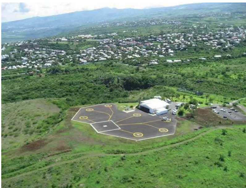
Figure 2 : Vue aérienne des installations de l'hélistation de L'Éperon

Les vols utilisent une trouée de décollage et d'atterrissage orientée à 310°-130° par rapport au nord, d'une longueur de 3 300 m et située en dehors des zones habitées. Les hélicoptères l'empruntent avec une pente de 4,5 % après leur décollage ou avant leur atterrissage. On note que la trouée débouche sur un dépôt d'explosifs, dans le prolongement de l'axe d'approche, dont le survol est interdit, ce fait est mentionné dans le plan de prévention des risques technologiques. Les hélicoptères s'écartent donc de cet axe sans le survoler.