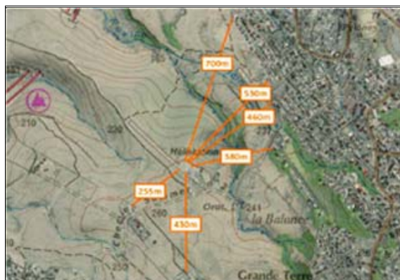
Figure 4 : Distance de l'hélistation aux habitations les plus proches

L'étude de bruit à proximité de l'hélistation est particulièrement développée : six points de mesure ont été utilisés pour mesurer l'ambiance sonore initiale et l'émergence sonore de vols d'hélicoptères. A partir de ces données mesurées, un modèle tridimensionnel a été calé : il permet de qualifier l'impact sonore lié au trafic d'hélicoptères. À l'état initial le niveau de bruit ambiant est relativement modéré (inférieur à 55 dB (A)).