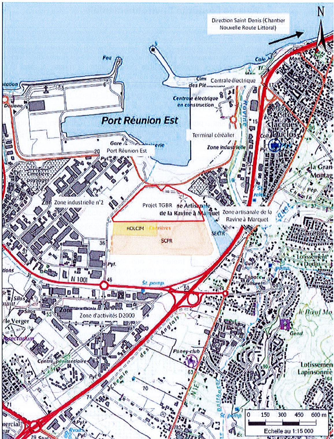
Localisation du projet et activités aux alentours (extrait du dossier d'étude d'impact)