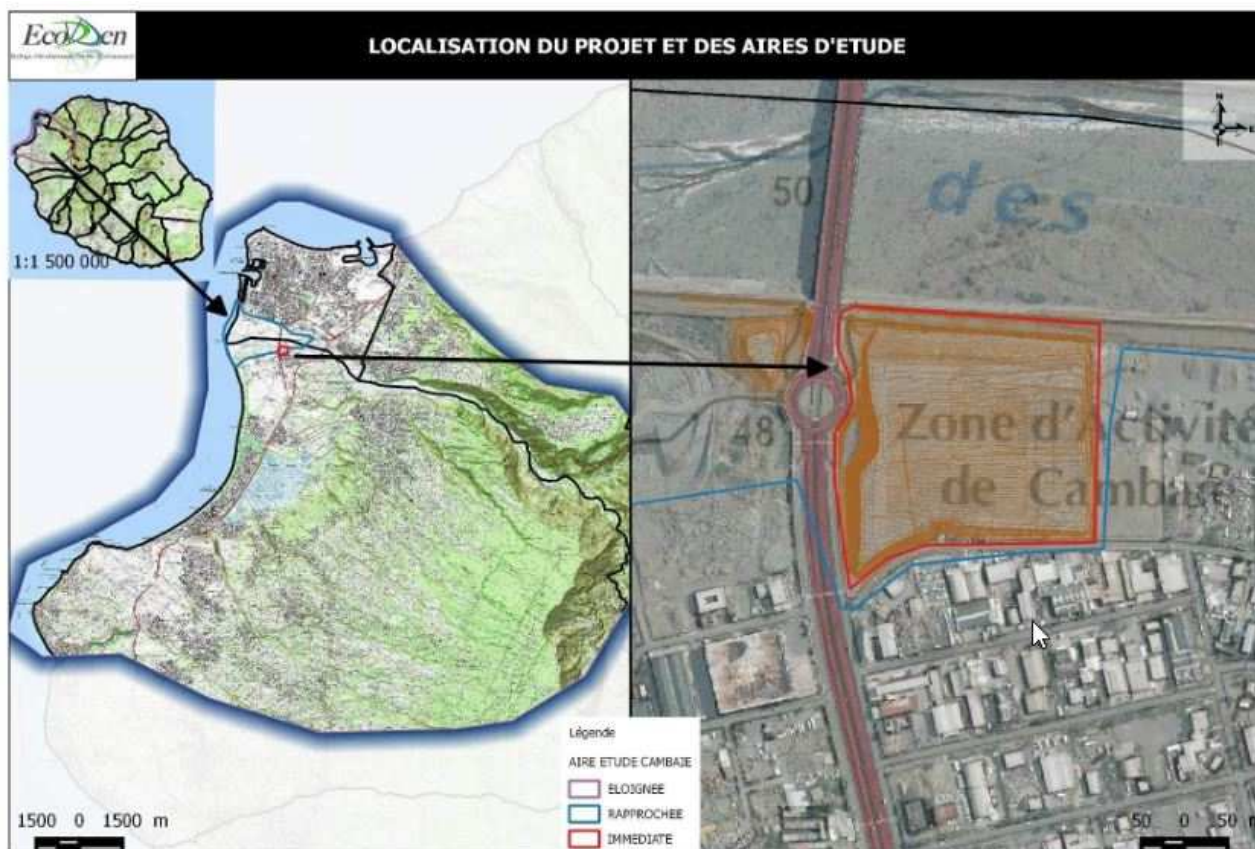
Plan de localisation du projet (extrait de l'étude d'impact – cf. page 27)

Dans ce cadre, ledit projet d'une emprise totale de 4 ha est lauréat d'un appel à projet du TCO et le pétitionnaire ambitionne pour celui-ci d'être retenu en 2020 au niveau de l'appel d'offres de la Commission de Régulation de l'Énergie (CRE).