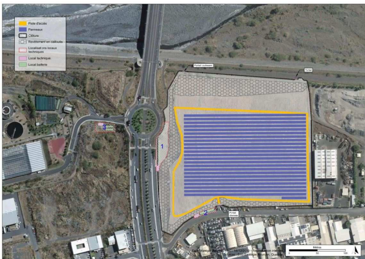
Vue en plan du projet avec les trois variantes d'implantation des locaux techniques (extrait de l'étude d'impact – cf. page 18)

La centrale sera équipée d'un espace de circulation périphérique de 4 m de largeur au minimum (piste d'accès), nécessaire à la maintenance et permettant l'intervention des services de secours et de lutte contre l'incendie.