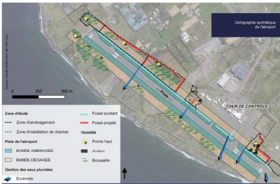
Figure 3 : Présentation de l'aéroport et des travaux projetés (source dossier)

Il est prévu de dimensionner le fossé et d'inverser sa pente de façon à générer des zones de rétention dans les cas où le débit de fuite ne sera pas suffisant. Les volumes à stocker en fonction des exutoires ont été calculés pour des périodes de retour de 10, 20 et 100 ans.