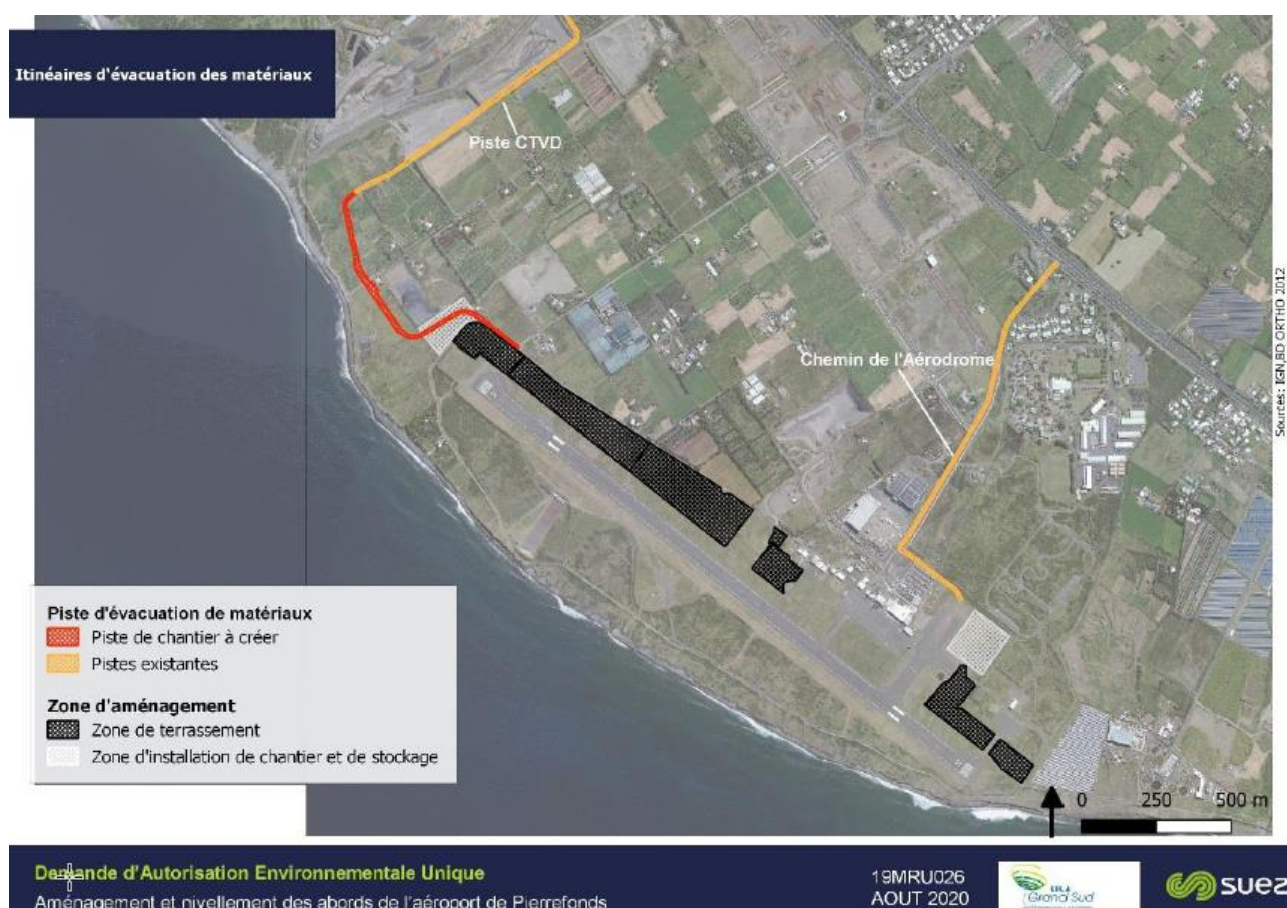
Figure 2 : Itinéraires d'évacuation des matériaux (source : dossier)

Selon le dossier, l'itinéraire des camions qui transporteront les matériaux n'est pas encore défini, mais leur circulation étant interdite dans la ZAC, il est précisé qu'« une voie des carriers est en cours d'étude par la CIVIS 5 pour la circulation des poids lourds des carriers sur le secteur ».