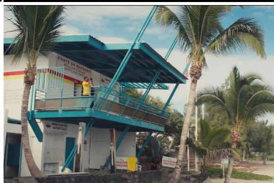
You can also throw yourself into water activities