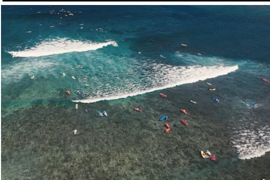
Profitez aussi des activités nautiques sans risque requin