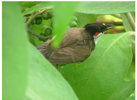
Merle de Maurice

Une fois installées ces espèces peuvent s'accaparer l'habitat de nos espèces indigènes et les empêcher de subsister dans les milieux où on trouve les deux espèces parce qu'elles sont beaucoup plus « efficaces » pour tirer parti du milieu ou parce qu'elles se reproduisent vite que les espèces indigènes ou encore parce qu'elles les consomment (c'est le cas du