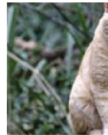
Chat ( Felis catus ) Espèce exotique se retrouve à l'état sauvage)